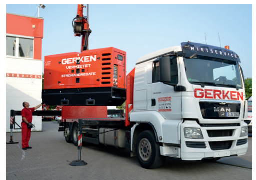
Bei Gerken erhalten Sie umfangreiches Zubehör rund um die Raumcontainer. Mieten Sie z. B. Stromaggregate und Lichtmasten direkt bei Gerken.