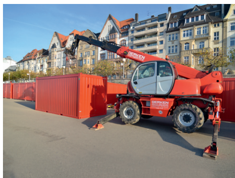
Leistungsfähige Transport-Fahrzeuge liefern die Container an, für schwierige Einsätze stehen Rotor-Teleskopstapler zur Verfügung.