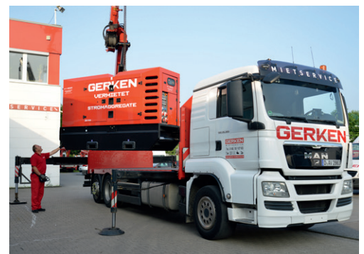
Bei Gerken erhalten Sie umfangreiches Zubehör rund um die Raum-Container. Mieten Sie z.B. Strom-Aggregate und Lichtmasten direkt bei Gerken,