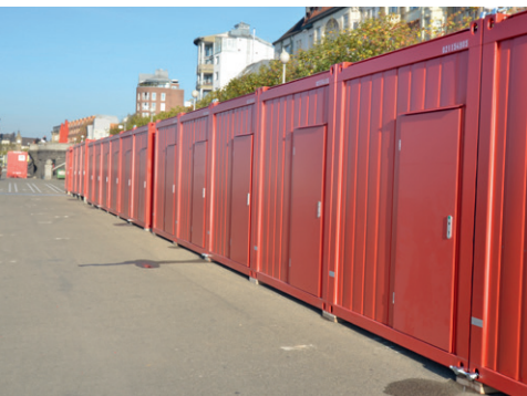
Gerken Containeranlagen haben sich bei großen Sportevents, wie z. B. dem FIS-Cup in Düsseldorf, bestens bewährt.