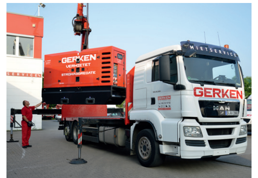
Bei Gerken erhalten Sie umfangreiches Zubehör rund um die Raumcontainer. Mieten Sie z. B. Stromaggregate und Lichtmasten direkt bei Gerken.

Jetzt kostengünstig anmieten: 0800 - 50 10 783